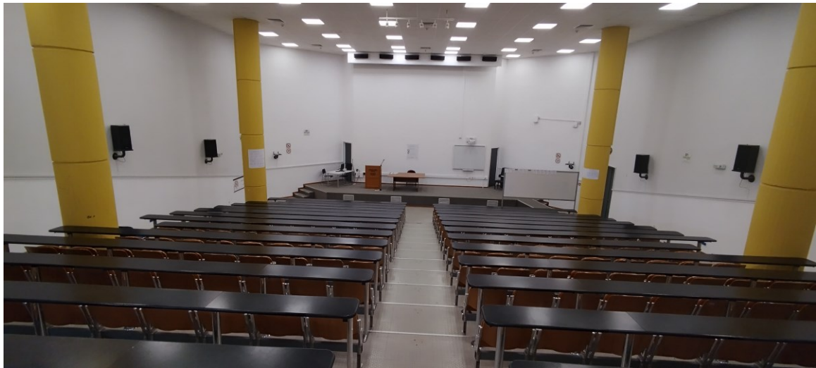
Εικόνα 2: Άποψη από το πίσω μέρος προς το μέτωπο διδασκαλίας.

Ο βασικός οπτικοακουστικός εξοπλισμός που θα εγκατασταθεί και παραμετροποιηθεί στην αίθουσα της Ιατρικής του Πανεπιστημίου Κρήτης θα περιλαμβάνει τα ακόλουθα: