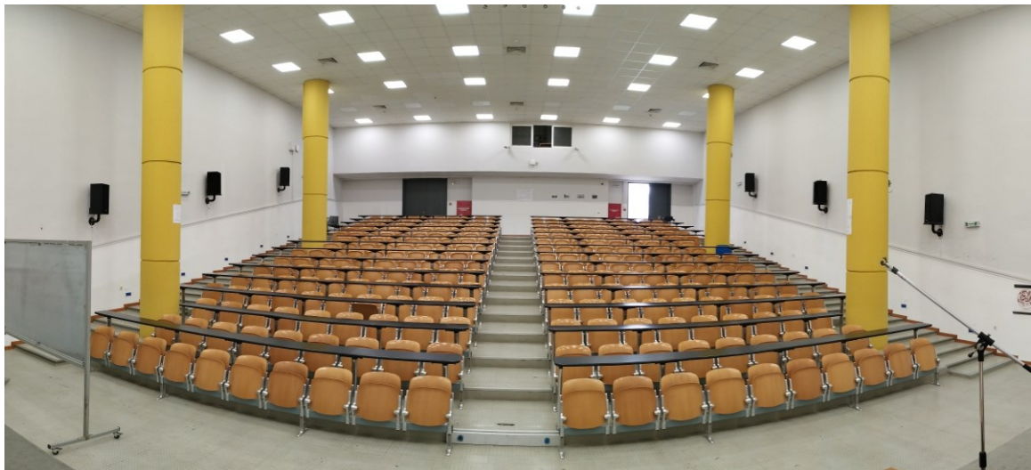
Εικόνα 1: Πανοραμική άποψη από την έδρα προς το ακροατήριο.